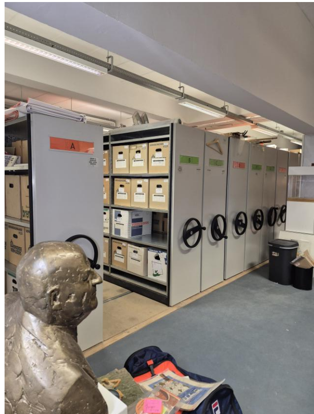
Efficiënte opbergruimte in het sporterfgoed depot

binnen het sporterfgoed van NOC*NSF in de loop der jaren is opgebouwd inzake conservering, digitalisering en ontsluiting van de collectie. En daarmee samenhangend de vraag welke mogelijkheden er zijn in subsidiëring van die zaken. In 2025 is het overleg met Sporterfgoed (door omstandigheden van die zijde) nog niet op gang gekomen, maar dit heeft voor Atletiekerfgoed prioriteit voor 2026.