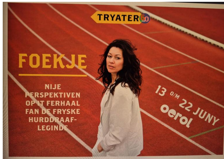
Aankondiging voor de voorstelling 'Foekje' op het festival Oerol

Stichting Atletiekerfgoed Papendallaan 7 6816 VD Arnhem www.atletiekerfgoed.nl