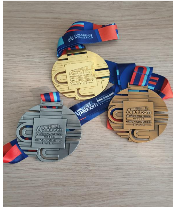
De medailles van de EK-Indooratletiek 2025

Na afloop van het voor Nederland en de Atletiekunie uiterst succesvolle toernooi ontving de Stichting Atletiekerfgoed een complete set van de medailles (foto) die tijdens dit toernooi werden uitgereikt.