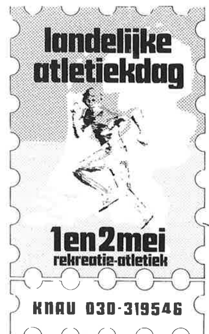
Een van de vele recreatie-activiteiten

Tal van projecten kwamen van de grond om de ongeorganiseerde loper aan een club te binden, zoals de 'Landelijke Atletiekdag'. Dat gebeurde ook door het opleiden van looptrainers, het houden van clinics, fitheidstests, het verspreiden van trimloopboekjes, Coopertestkaarten alsmede werving- en blesurefolders. Inmiddels zijn honderden door de KNAU opgeleide trai-