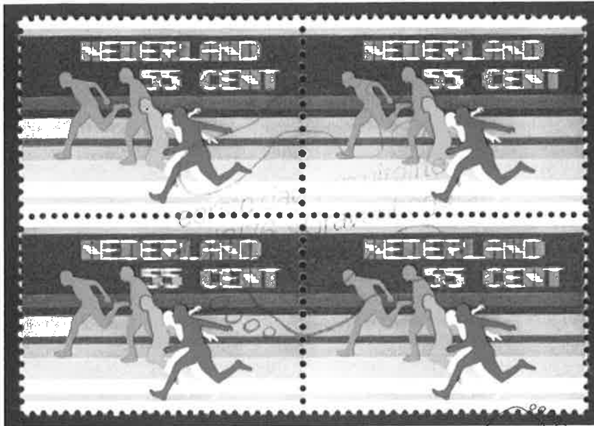
Ter gelegenheid van het 75-jarig bestaan van de K.N.A.U. gaf PTT voor de eerste keer een speciale atletiek-postzegel uit. De opdruk van 55 ct. betrof het toen geldende briefport