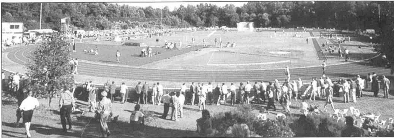
De kunststofbaan op Papendal

ners en assistent-trainers aan het werk. Veel clubs hebben nu bloeiende lopersgroepen. In 1996 begon de KNAU met het project 'Loopsport' dat als thema 'gezond en veilig lopen' meekreeg. In 1998 volgde 'Loopservice Nederland'. Doel van dit project is de lopers die zich niet willen binden aan clubs met hun contributies, regels, vaste trainingstijden en eigen locaties, een vorm van begeleiding te bieden. Zij kunnen zich nu rechtstreeks aanmelden bij de KNAU zonder lid te worden van een club. De voordelen van dit lidmaatschap moeten hen helpen de hardloopsport veilig en gezond te beoefenen door middel van service en ondersteuning. Hoewel het aantal ongebonden lopers nog steeds meer dan twee miljoen bedraagt, is 'Loopservice Nederland' een succes. De steun van Delta Lloyd, NUON, AA-Drink en Polar is daarbij onontbeerlijk.