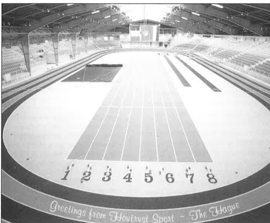
De komst van de Houtrustsport was hard nodig

De hallen gingen tegen de vlakte en maakten in 1935 plaats voor de Nenijto-sintelbaan. Nederland moest voor zijn eerste indoorwedstrijd nog tweeëndertig jaar wachten. Dat gold niet voor Engeland, waar al op 7 november 1863 in de Asburnham Hall in het Londense district Chelsea de eerste indoor-atletiekwedstrijd plaatsvond. Vijf jaar later zagen ruim 2000 toeschouwers de première in New York. Daar werd gestart met een slag op een bas-trom. In de Verenigde Staten bleef indooratletiek vele jaren populair, met grote