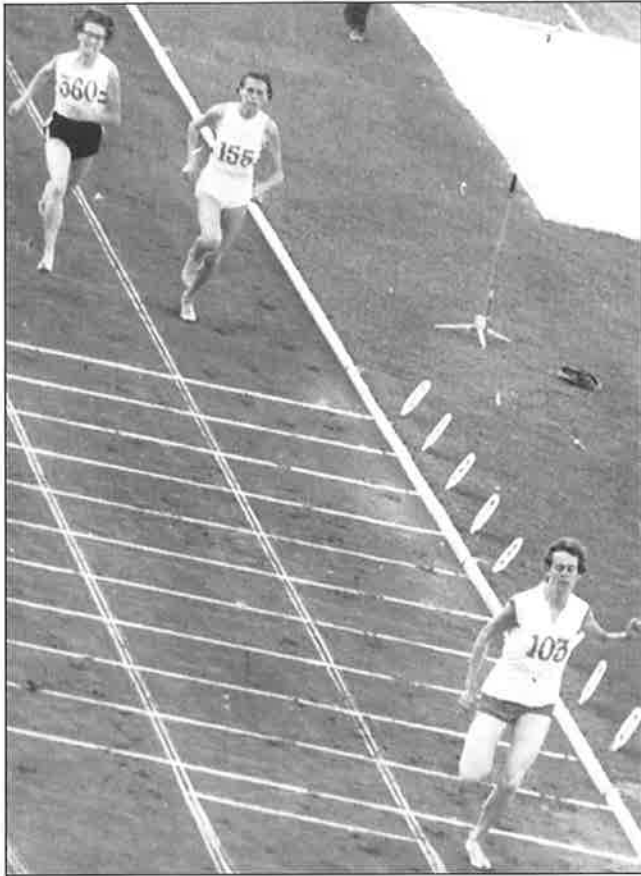
Met overmacht werd Gerda Kraan in Belgrado Europees kampioene 800 meter

op 2.05,5. In dat jaar verloor zij géén wedstrijd. Vanaf 1959 was zij vijfmaal achtereen Nederlands kampioene op de 800 meter. Op die afstand brak zij tienmaal het nationale record. Zij deed dat ook drie keer op de 400 meter. In 1968 beëindigde zij haar sportcarrière. Gerda Kraan luidde een tijdperk in, waarin onze middenafstandloopsters een rol van betekenis speelden.