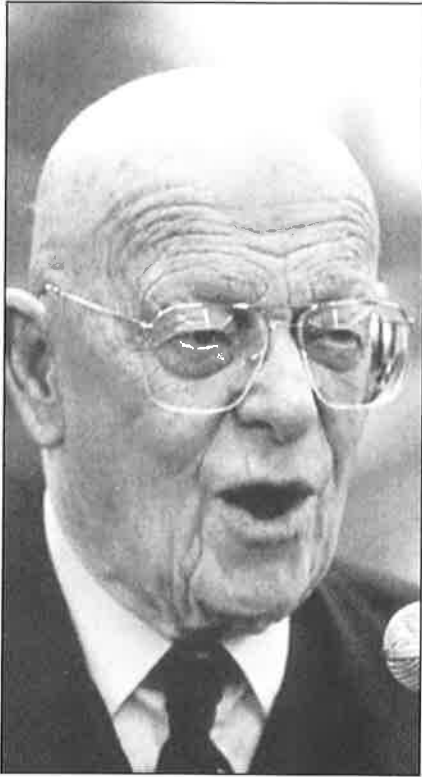
Adriaan Paulen ere-president van de IAAF

vonden hem autoritair en kwalificeerden hem als een regent. Hij stond pal voor zijn idealen. Goedkope populariteit interesseerde hem niet. Hij werd in het buitenland veel meer gewaardeerd om zijn enorme kennis en werkkraft dan in eigen land, waar hij ooit 'de wereldrecordhouder blauwe blazerdrager' werd genoemd. Als atleet was hij al een opgewonden standje. Dat kwam hem tweemaal op een schorsing te staan, omdat hij juryleden had uitgescholden.