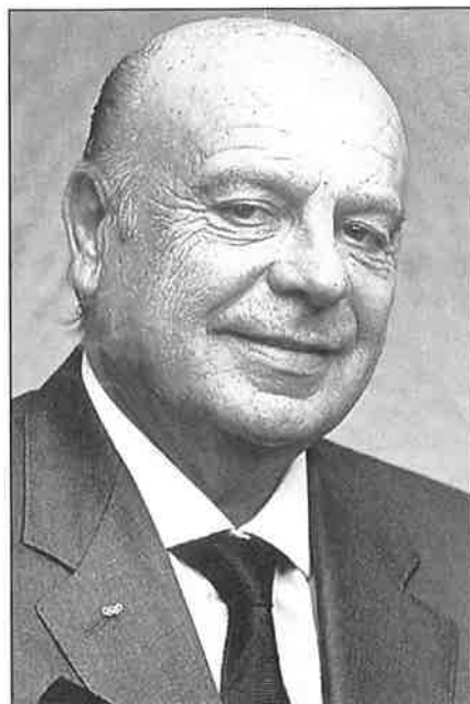
Primo Nebiolo: Big boss van de IAAF

Nebiolo bouwde ‘zijn’ federatie in korte tijd op tot ‘s werelds grootste sportorganisatie, waarvan in de 21ste eeuw meer dan 210 landen deel uitmaken. Hij verkreeg vooral aanhang in de derde wereldlanden die hij veel ontwikkelingsgelden toeschoof. Hij kon bij de kleinere