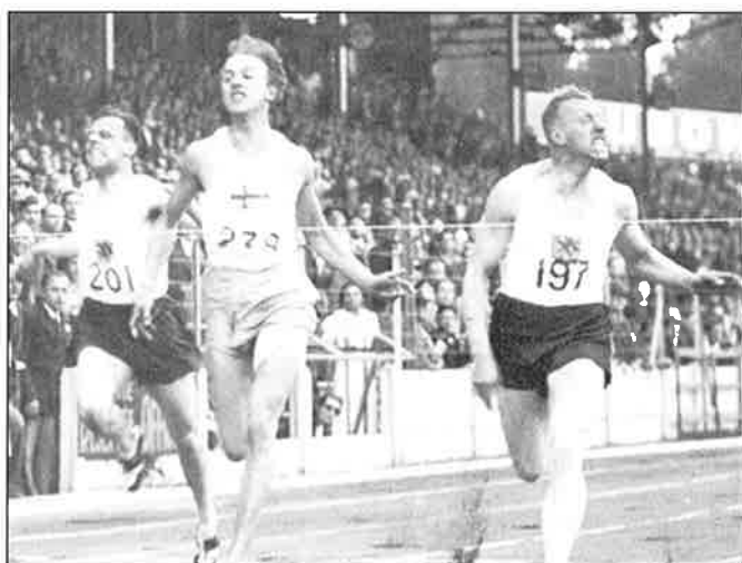
Tinus Osendarp (197) Europees kampioen 100 en 200 meter in 1938. De geblesseerde Wil van Beveren (201) werd derde op de 100 meter

Bij de mannen werd in 1938 Tinus Osendarp de opvolger van Europees kampioen Chris Berger. Hij won in het Stade de Colombes de 100 meter en 200 meter in 10,5 en 21,2. Karl Baumgarten behaalde in Parijs zilver op de 400 meter in 48,2. Jan Brasser veroverde brons op de 110 meter horden in 14,8. Vierde plaatsen behaalden Wil van Beveren op de 100 meter in 10,6 en Sjabbe Bouman op de 800 meter in 1.52,3.