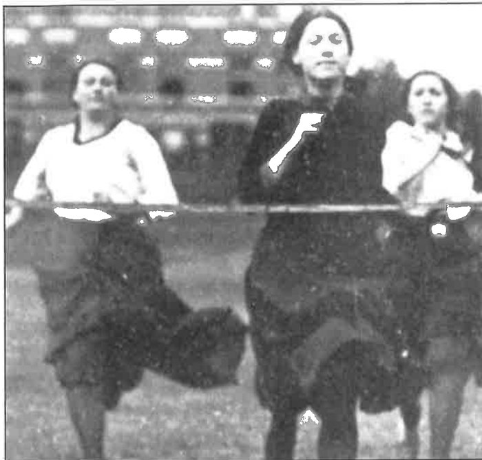
Vrouwen- atletiek in 1913