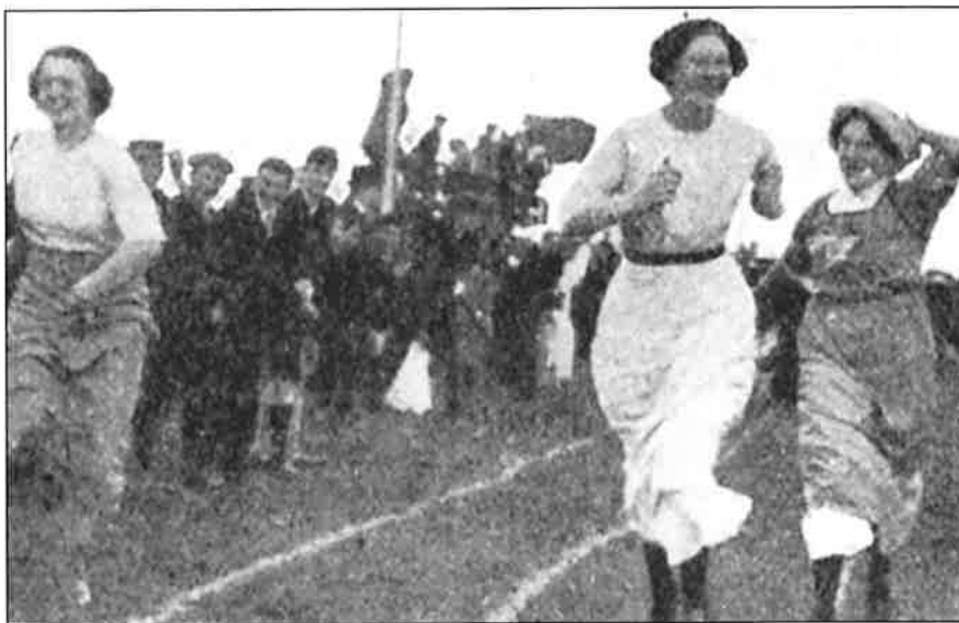
Vrouwenatletiek in 1913

jaar een samenwerking aan met de FSFI. Door de nauwere band met de IAAF nam Nederland in 1930 voor het eerst deel aan de Vrouwen Wereld Spelen. De IAAF deed in 1936 nog meer concessies door de FSFI als vrouwencommissie in de organisatie op te nemen. Toch duurde het tot de jaren vijftig, voordat atletiek voor vrouwen algemeen werd aanvaard. Niet alleen loopnummers, maar ook onderdelen als verspringen, kogelstoten, discuswerpen en speerwerpen vond men niet vrouwelijk. Lange tijd heerste de mening dat vrouwen door sport-