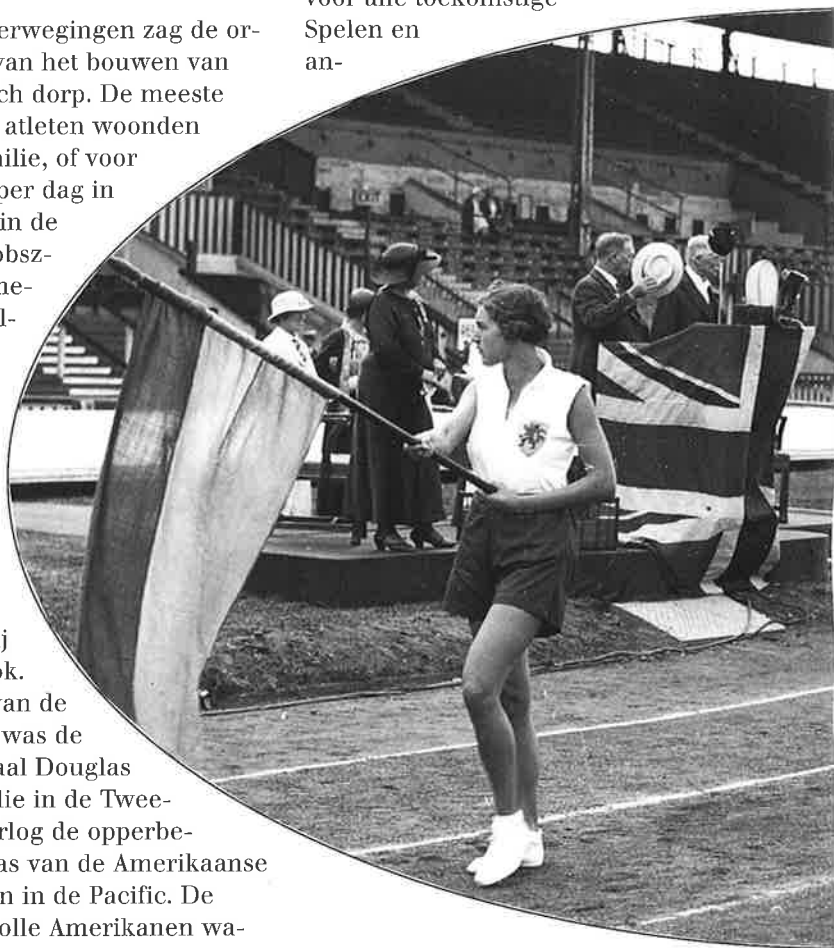
Opening van de Wereld Spelen voor vrouwen

loop van het voetbal- en hockey-toernooi zou worden aangelegd. Dat gebeurde ook, maar de veel te losse baan bleek volledig ongeschikt te zijn. Gelukkig was KNAU-trainer Kreigsman bereid hulp te bieden. Zonder zijn kennis en kunde had het atletiek-gedeelte niet kunnen doorgaan. Het betekende wel dat de atleten het veertien dagen zonder Kreigsman moesten stellen. De atletiekbaan van 400 meter werd de standaardlengte voor alle toekomstige Spelen en an-