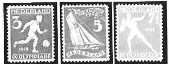
Hoeier / scherrner Voetballer / Zeller / Kogelstoter