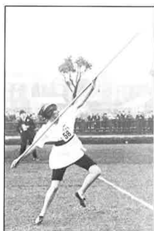
Ook een manier van werpen