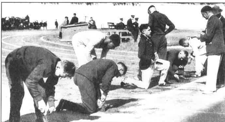
Kuultjes graven bij start 100 meter in het Olympisch Stadion

‘ – de Spelen zijn van oorsprong heidens – de Spelen zijn een uiting van brute kracht – het is een kermis van ijdelheid – het voorstel is in strijd met het apostolisch woord, dat van de lichamelijke oefening zegt, dat zij weinig nut heeft – de massa grijpt naar de vermaaken der oude Grieken – het Nederlandsche volk wordt op deze manier niet aangezet tot zuinigheid en soberheid, maar in tegendeel aangespoord tot uitgaan, genieten en uitgeven – God en zijn woord worden veracht – de vrouw, door de sportmanie aangegrepen, gaat haar gevoel van kiesheid en eerbaarheid verliezen, zij werpt zich half gekleed op de sportmarkt der gemakelijkheid – dat wat de vrouw siert, dreigt te verdwijnen.’