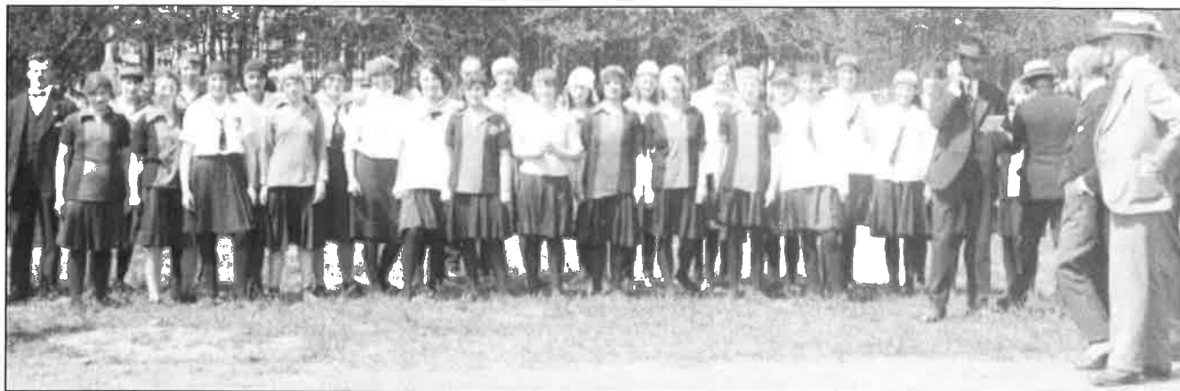
De eerste veldloop voor vrouwen in de bosjes van Poot in Den Haag in 1921