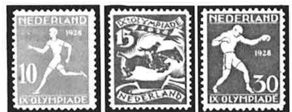
Hardloper / Ruiter / Bokser