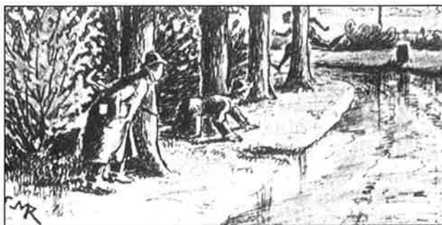
De bedrieger gepakt naar een tekening van Pim Mulier

Al vóór de oprichting van de NAU in 1901 hielden veel clubs zich met