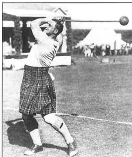
Hamerslingeren gebeurt nog elk jaar in Schotland bij de Highland Games

(1509-1547) weten wij niet alleen dat hij als Koning Blauwbaard twee van zijn zes vrouwen liet onthoofden, maar dat hij zich ook bekwaamde in het hamerwerpen. Dit werptuig bestond uit een houten steel, waaraan een steen was bevestigd in de vorm van een voorhamer. Het was de voorloper van kogelslingeren. In Engeland en Duitsland gelden nog steeds de benamingen: 'Hammer Throw' resp. 'Hammerwerpen'. België houdt het op hamerslingeren. Vanaf 1636 werden jaarlijks door de militaire academie in het Engelse Sandhurst atletiekwedstrijden gehouden. Deze wedstrijden,