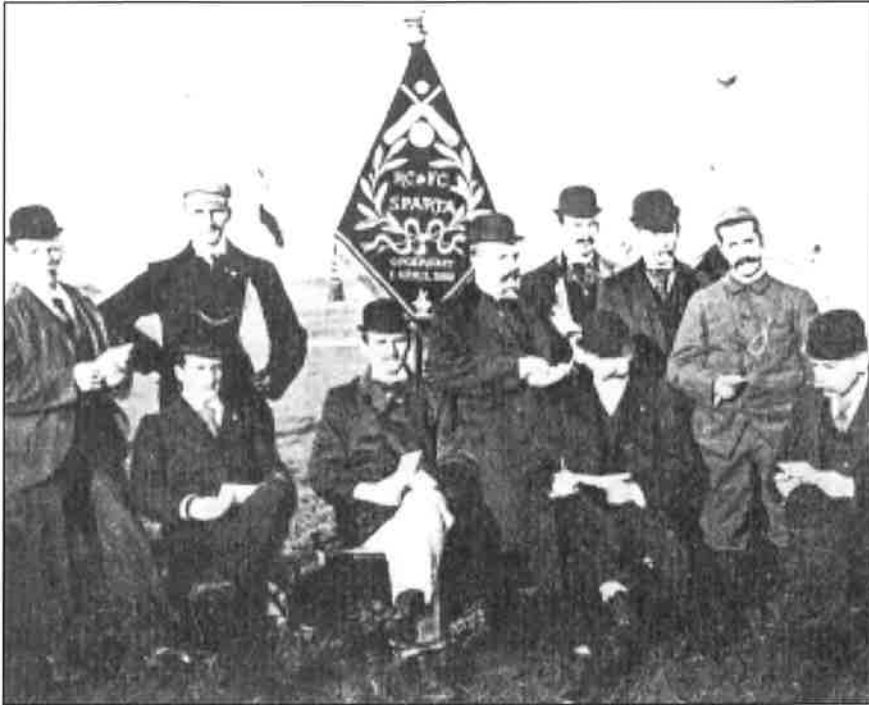
Juryleden van Sparta Rotterdam met vaandel bij een wedstrijd in 1893

De Spartaan (Amsterdam), AFC (Amsterdam), DWS (Amsterdam), De Volewijckers (Amsterdam), UVV (Utrecht), Velox (Utrecht), DFC (Dordrecht), Quick (Nijmegen), HBS (Den Haag), HVV (Den Haag), VUC (Den Haag) en Be Quick (Groningen).